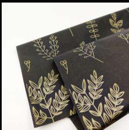
czarny motyw roślinny