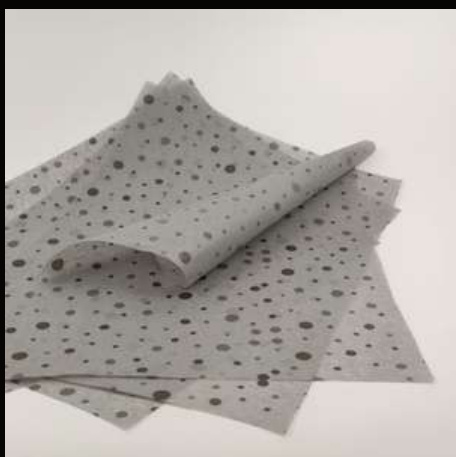
szara w kropki